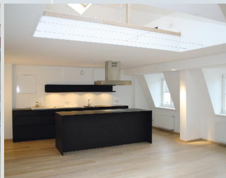
DACHGESCHOSSAUSBAU: Ausbauen, umbauen, aufstocken – alles fachgerecht aus einer Hand.